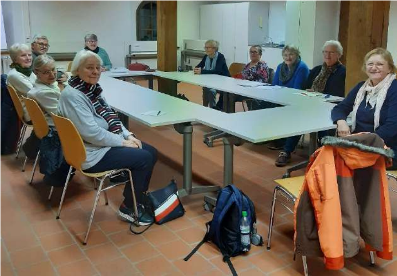
Gruppentreffen in Ingolstadt am 09.01.2023

Ebenso waren starke Schmerzen in den Füßen ein Thema. Diese treten meist nachts auf, sodass der Schlaf stark gestört ist.