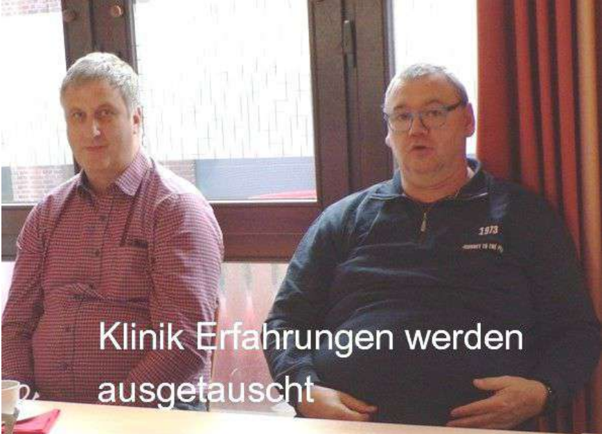
Klinik Erfahrungen werden ausgetauscht