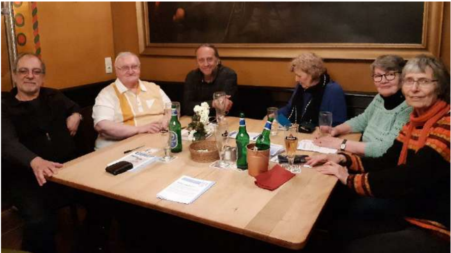
Teilnehmer und Teilnehmerinnen der Gruppe Nürnberg

Eine weitere Teilnehmerin war zum ersten Mal dabei und hatte demzufolge einige Fragen. So fragte sie, ob ALS und Polyneuropathie einen Zusammenhang haben könnten, da ihre Mutter an ALS verstorben sei. Da ich keine Ärztin bin, konnte ich diese Frage nicht wirklich beantworten. Hier wäre eine Anfrage an die Deutsche Hirnstiftung, bei der der DPS e. V. inzwischen Mitglied ist, sicher hilfreich.