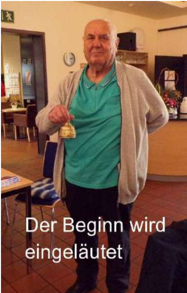
Der Beginn wird eingeläutet