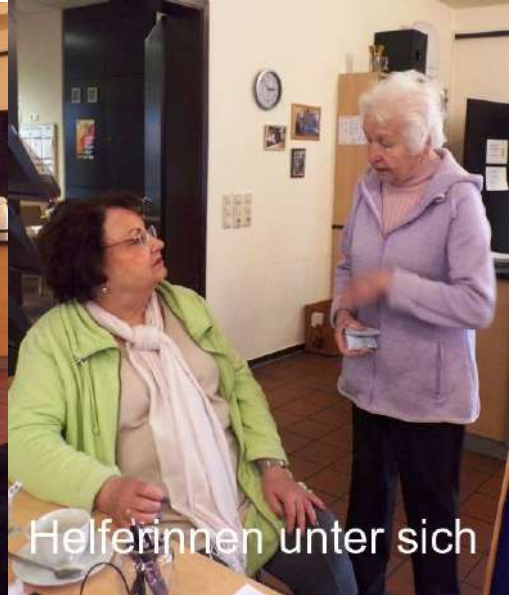
Helferinnen unter sich