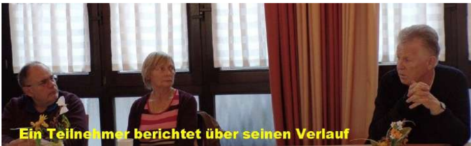
Ein Teilnehmer berichtet über seinen Verlauf