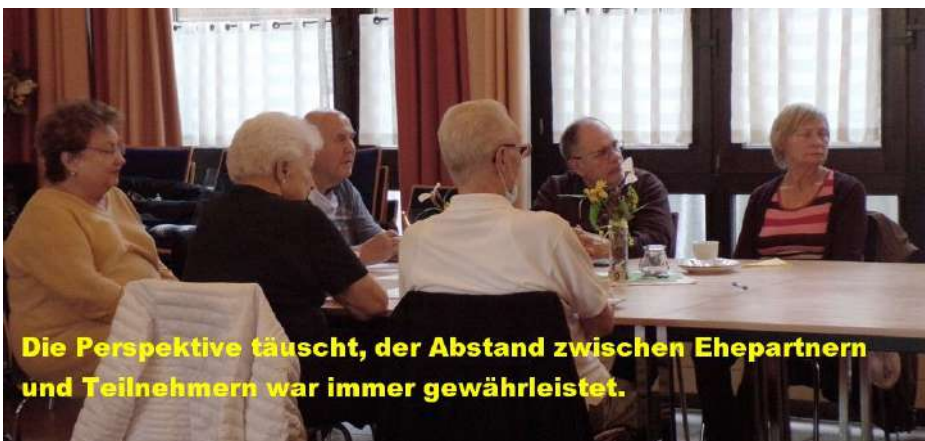
Die Perspektive täuscht, der Abstand zwischen Ehepartnern und Teilnehmern war immer gewährleistet.