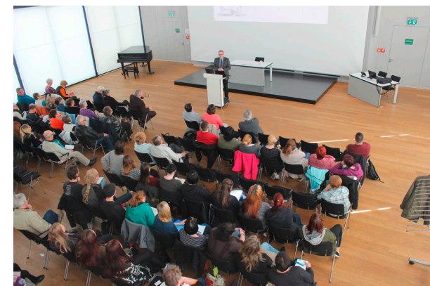
Der Schlaganfalltag lockt viele Besucher in den Bürgersaal