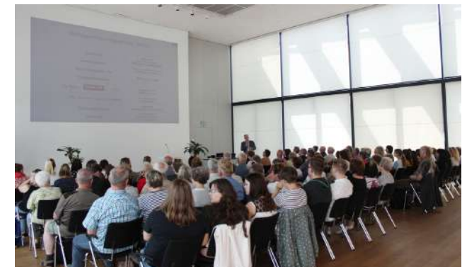
Der Schlaganfalltag lockt viele Besucher in den Bürgersaal.

Kontakt- und Informationsstelle für Selbsthilfe (KISS) Zwickau Sandy Wetzel Telefon: 0375 44 00 965